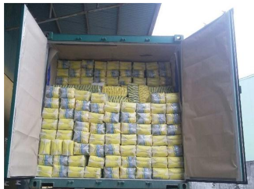
1kg bag * 20bag/package