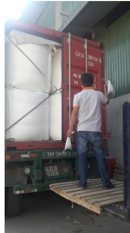
1 ton Jumbo bag